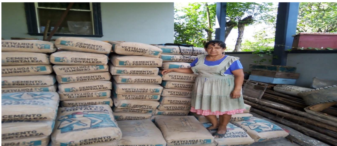
ENTREGA DE MATERIAL PARA CONSTRUCCION