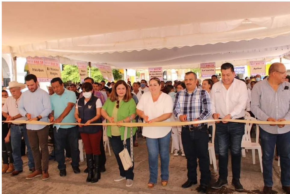
PARTICIPACION EN EL EVENTO DEL DIA NACIONAL DE LA ABEJA Y EXPOSICION DE PRODUCTOS DERIVADOS DE LA MIEL