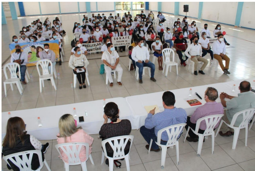
CREACION DEL COMITÉ MUNICIPAL DE CONAFE