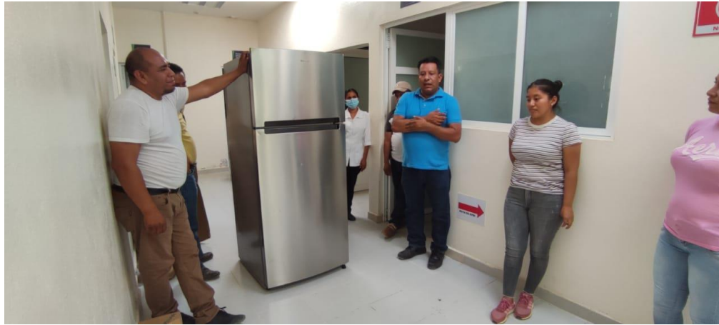
GESTION JUNTO CON LOS COMPAÑEROS REGIDORES DE UN REFRIGERADOR PARA EL CENTRO DE SALUD DE AHUATITLA