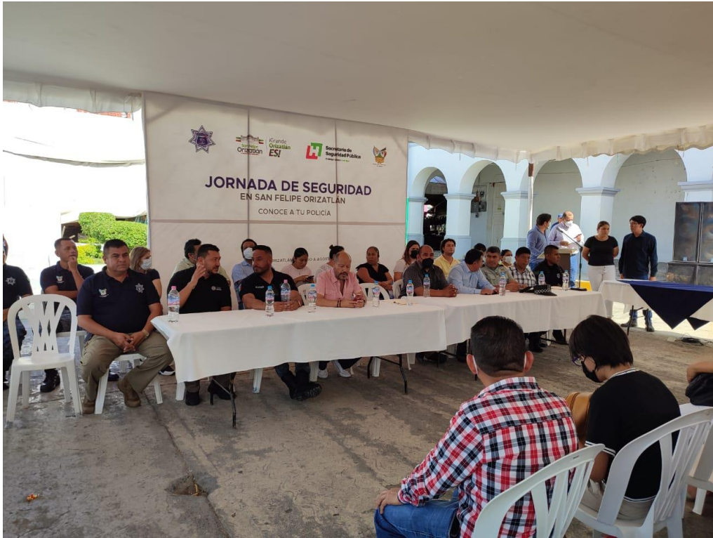
PARTICIPACION EN LA JORNADA DE SEGURIDAD