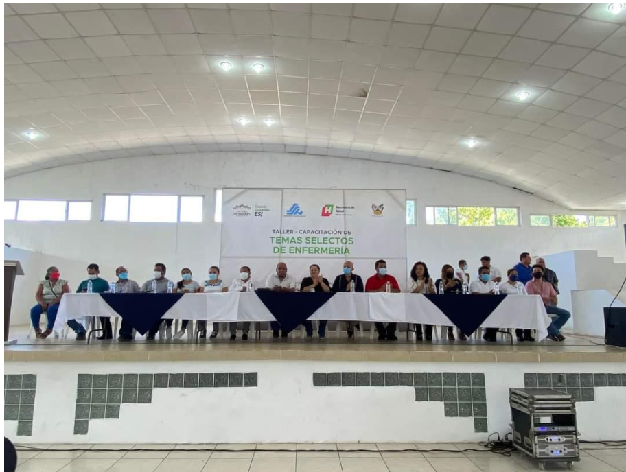
PARTICIPACION EN EL EVENTO PROTOCOLARIO DEL TALLER DE TEMAS SELECTOS DE ENFERMERIA