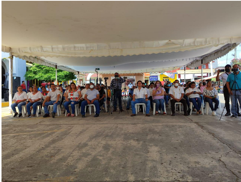
PARTICIPACION EN LA DEVELACION DE LA PLACA QUE DISTINGUE AL MUNICIPIO DE SAN FELIPE ORIZATLAN COMO PUEBLO CON SABOR