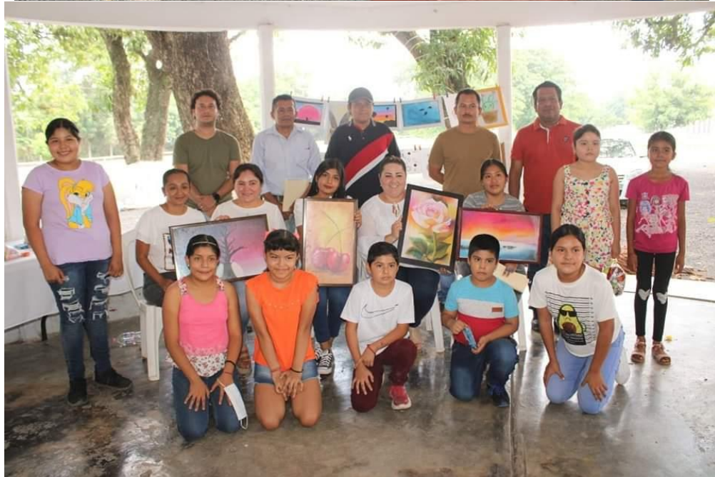
PARTICIPACION EN LA CLAUSURA DE CURSOS DE VERANO