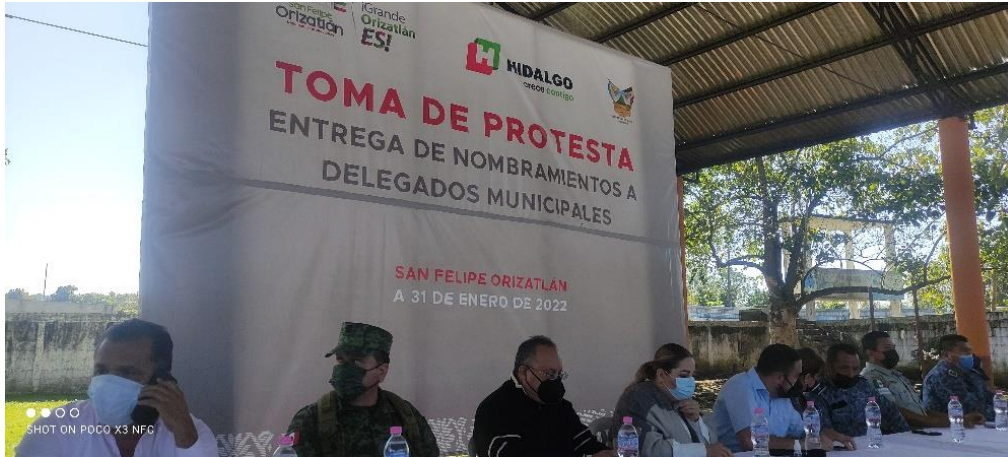
PARTICIPACION EN LA TOMA DE PROTESTA DE DELEGADOS