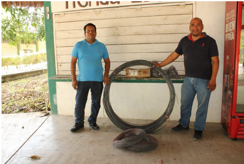
GESTION DE MATERIAL PARA LA BARDA DEL COBAEH PLANTEL AHUATITLA