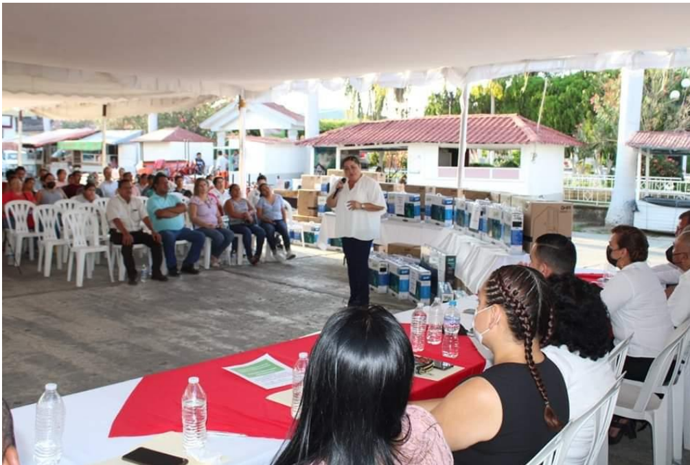
ENTREGA DE ÚTILES, LIBROS, MOBILIARIO A ESCUELAS DE NIVEL BÁSICO DEL MUNICIPIO