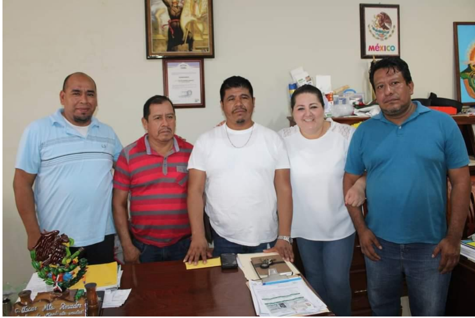
GESTION DE APOYO PARA LA FIESTA PATRONAL