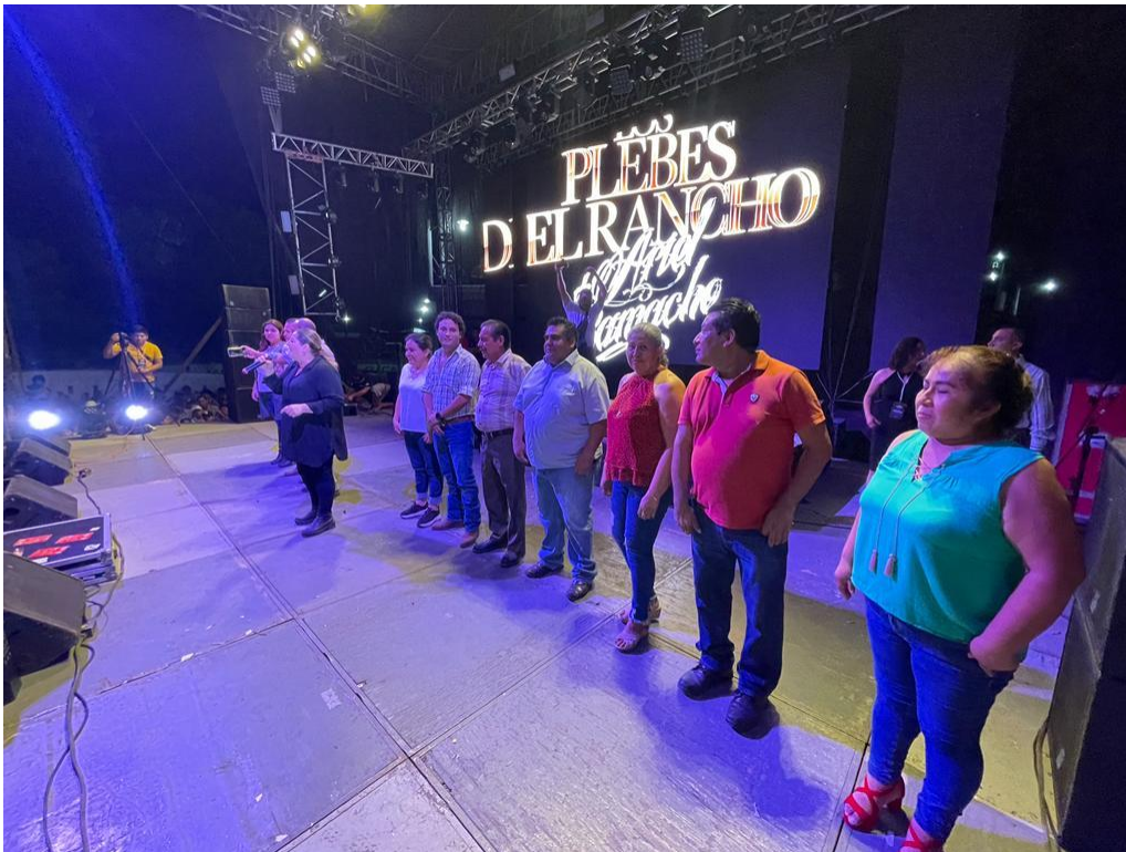
PARTICIPACION EN LA CLAUSURA DE LA FERIA 2022 SAN FELIPE ORIZATLAN