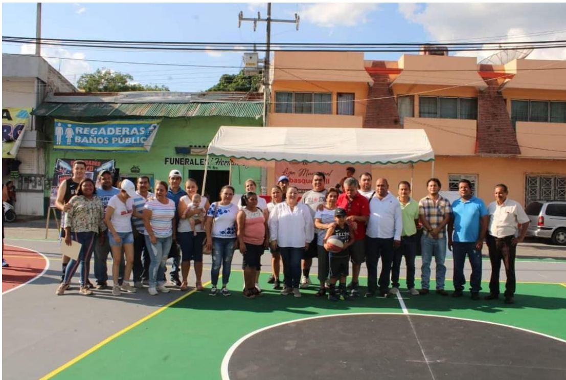
PARTICIPACION EN LA INAUGURACION DE CANCHA DE BASQUET BOL Y LIGA MUNICIPAL.