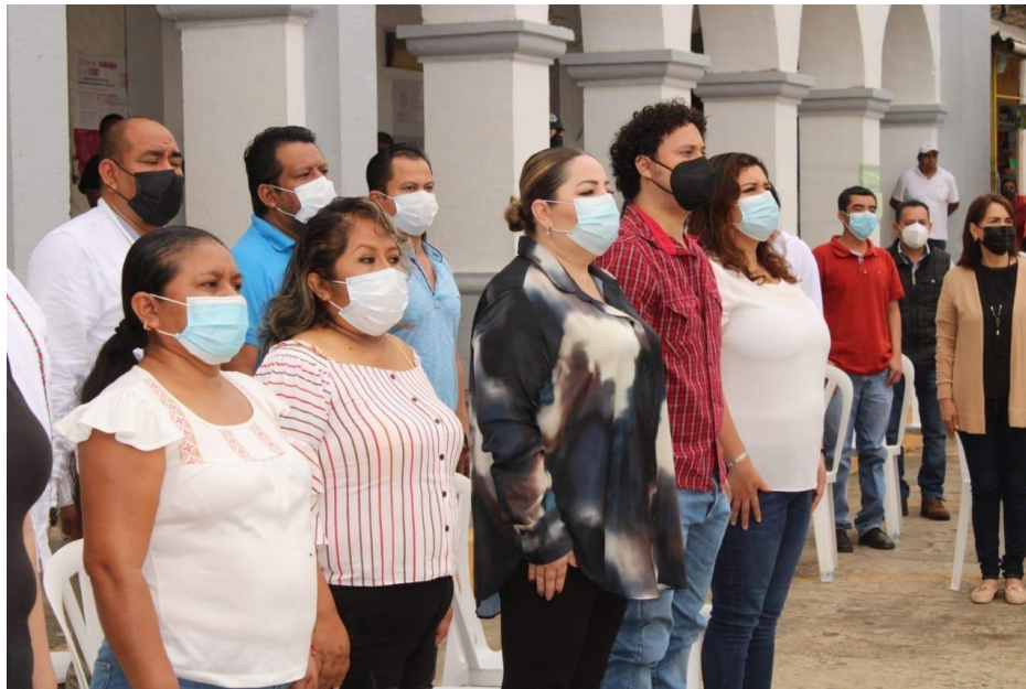
PARTICIPACION EN EVENTOS CIVICOS