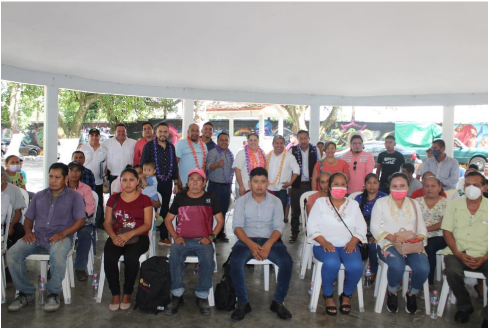
ACOMPañAMIENTO EN LA ENTREGA DE CERTIFICADOS A BENEFICIARIOS DEL PROGRAMA DE MEJORAMIENTO DE VIVIENDA