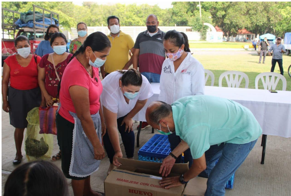
PARTICIPACION EN LA ENTREGA DE PAQUETES DE GALLINAS A BENEFICIADOS DE DIFERENTES LOCALIDADES DEL MUNICIPIO