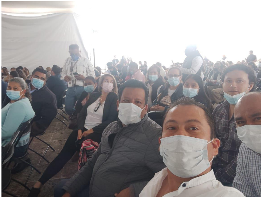
CAPACITACION EN PACHUCA PARA LEY DE INGRESOS