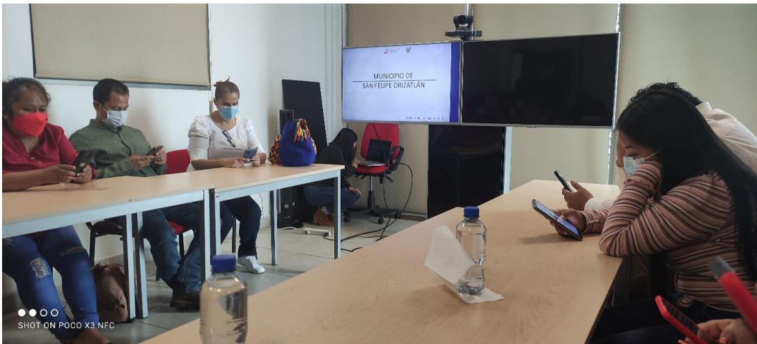
REUNION CON LA TITULAR DE LA SECRETARIA DE TRABAJO Y PREVISION SOCIAL DEL ESTADO DE HIDALGO, PARA TRATAR ASUNTOS IMPORTANTES DE LOS TRABAJADORES DEL MUNICIPIO.