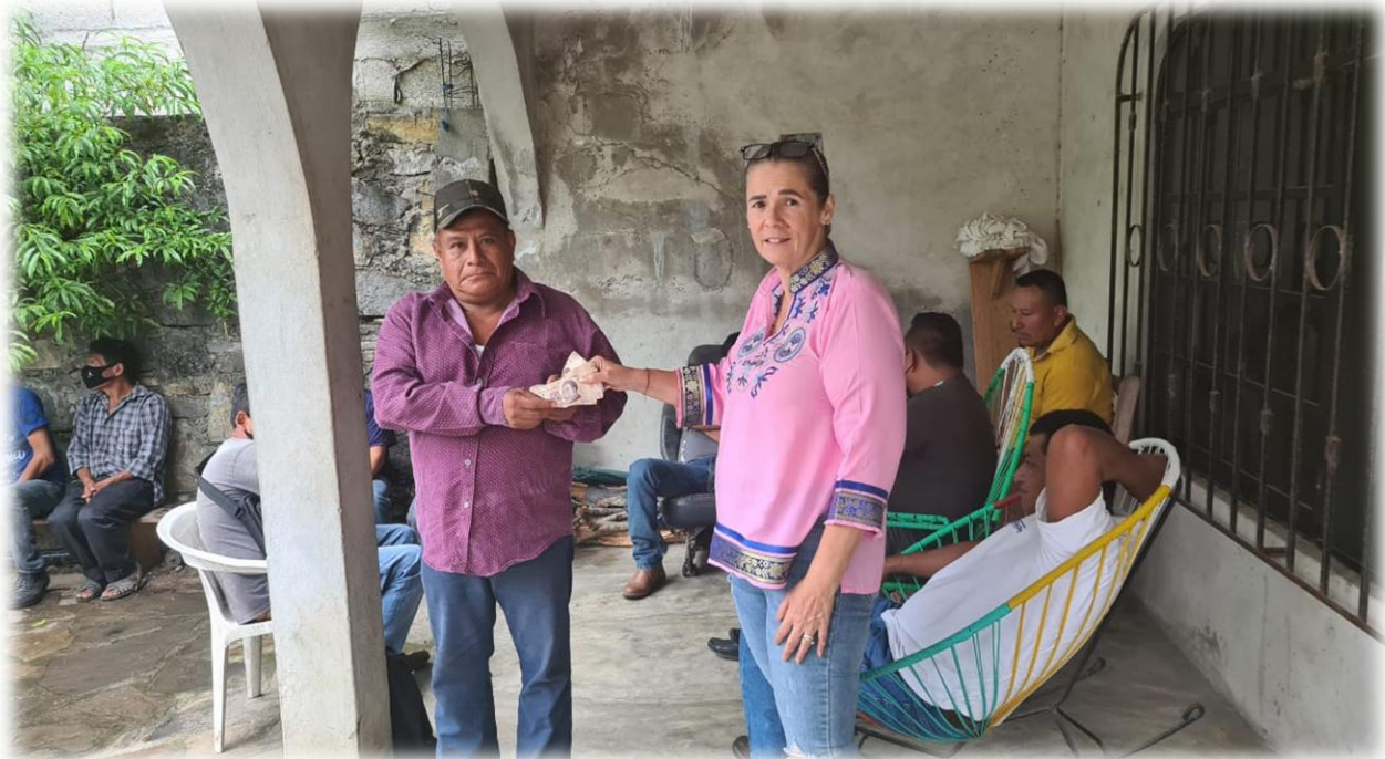
Apoyo Fiesta Patronal La Laguna.