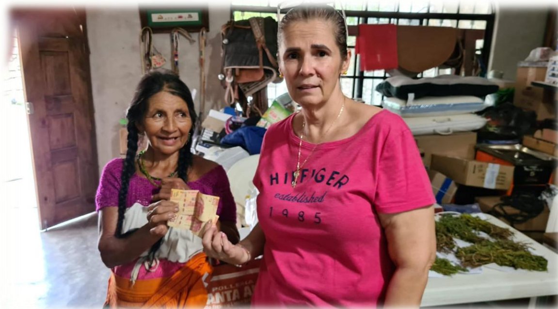
Apoyo económico comunidad 03 de marzo para medicamentos.