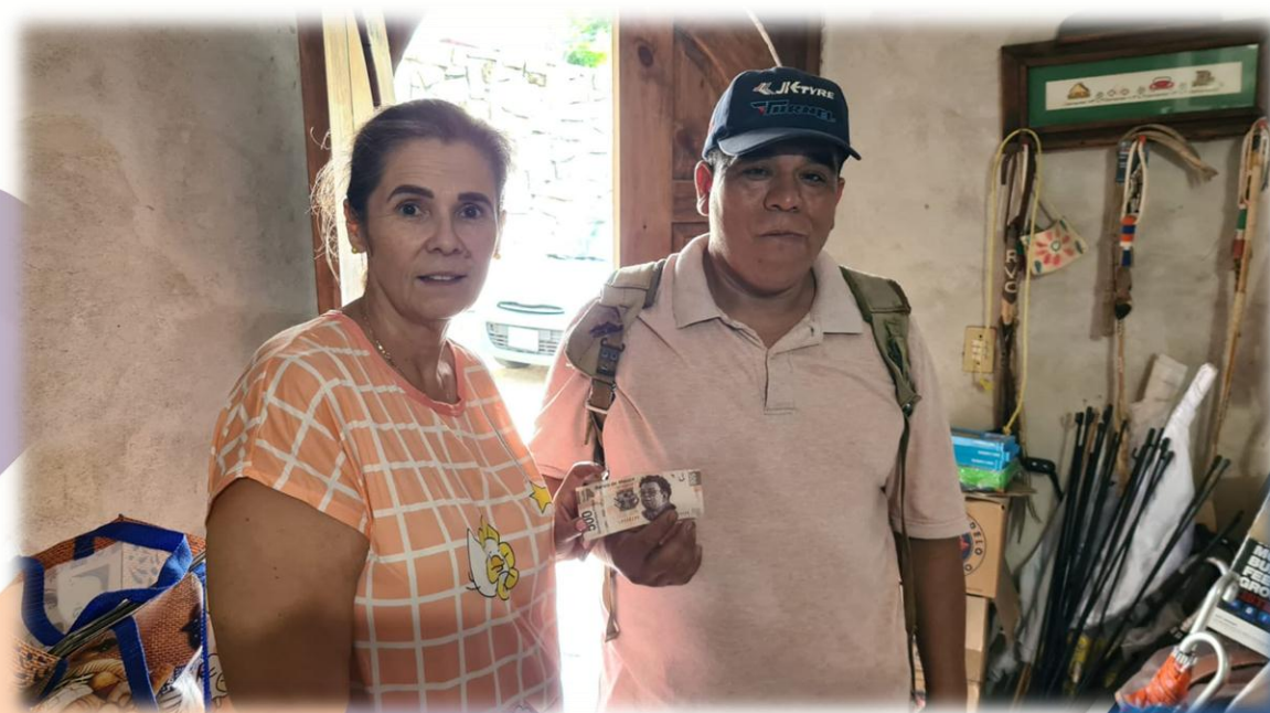
Apoyo económico al Señor Primitivo de la Comunidad de Totonicapa para medicamentos