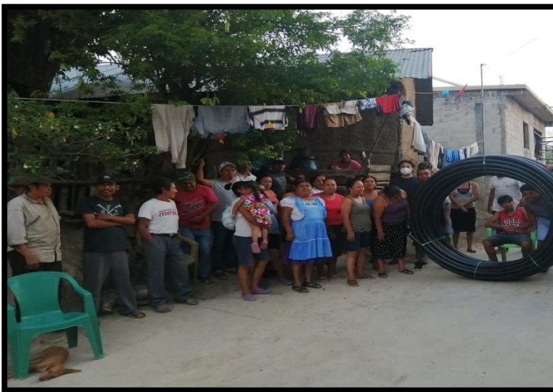
Gestión de Manguera para Agua, Barrio Zapoica Huitzitzilingo.

De acuerdo a la Ley Organica Municipal para el estado de Hidalgo con base en el artículo 69 fracción IX, XIII y XIV hago mención de las actividades que he realizado en este periodo para beneficio de los orizatlenses buscando obtener mejores oportunidades en proyectos actividades etc. Que se realizan y poder involucrar a las comunidades y que ellos sean los más beneficiados.