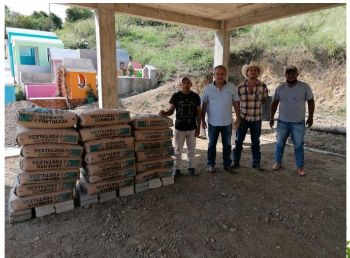
Entrega de Material para el Panteón