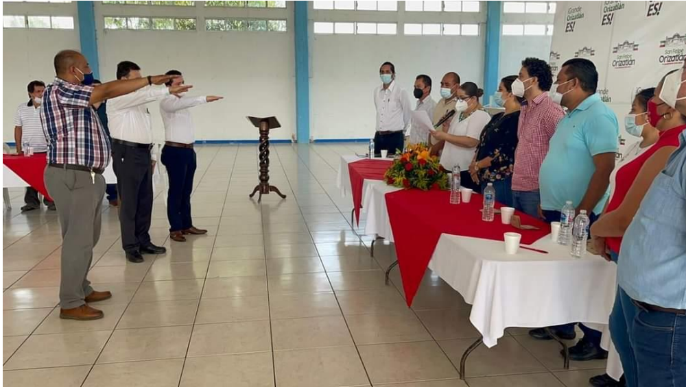
TOMA DE PROTESTA DE COMITÉ DE TRANSPARENCIA