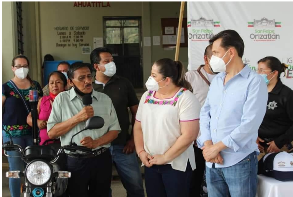
ENTREGA DE MOTOS PARA VIGILANCIA DE COMUNIDAD