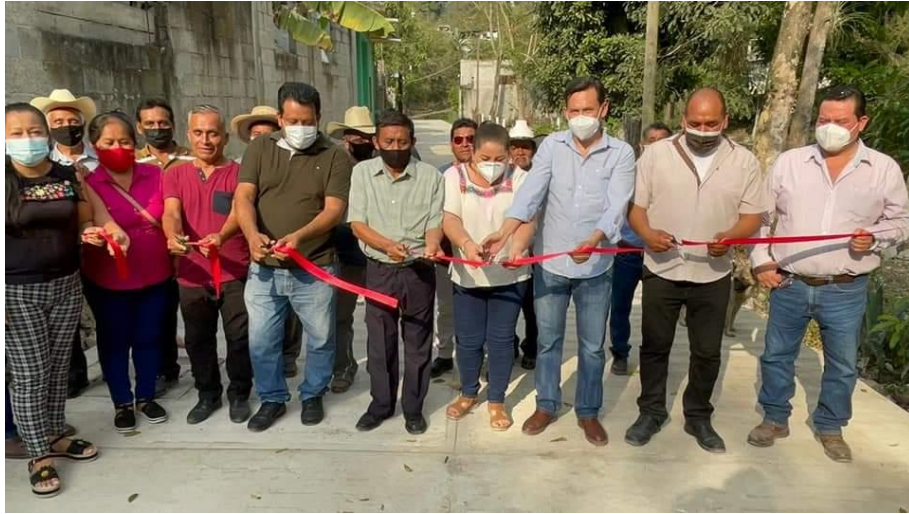
INAUGURACION DE OBRAS