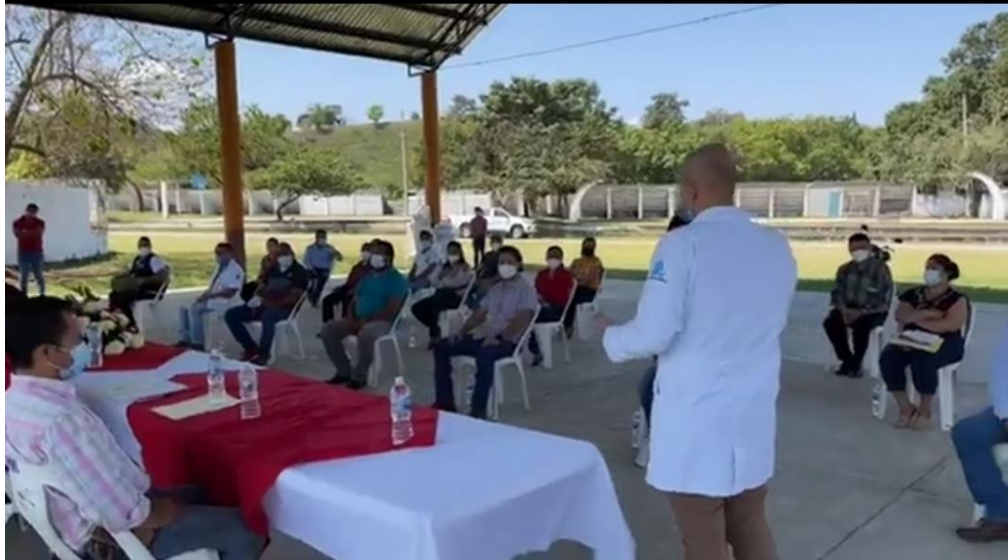
INSTALACION DEL COMITÉ DE SALUD