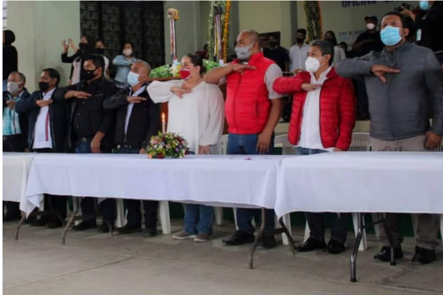
CAMBIO DE DELEGADO EN AHUATITLA ORIZATLAN HIDALGO

Durante este periodo se participó en diferentes actividades de acompañamiento y gestión con la presidenta municipal y con la ciudadanía. También es importante mencionar que se ha apoyado económicamente a personas que lo han solicitado para solventar gastos de salud, así como apoyos en especie a diferentes personas.