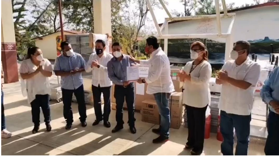
ENTREGA DE MATERIALES ESCOLARES A ESCUELAS DE NIVEL BASICO