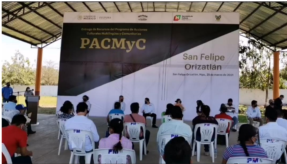
ENTREGA DE CERTIFICADOS DE APOYO PACMYC