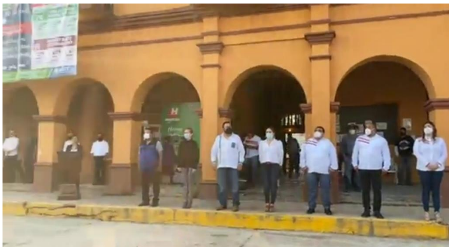
PARTICIPACION EN ACTOS CIVICOS Y CONMEMORATIVAS