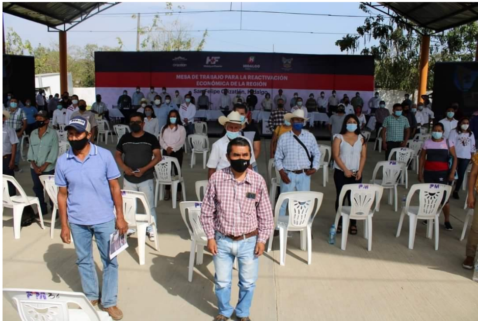
MESA DE TRABAJO CON PERSONAL DEL GOBIERNO ESTATAL